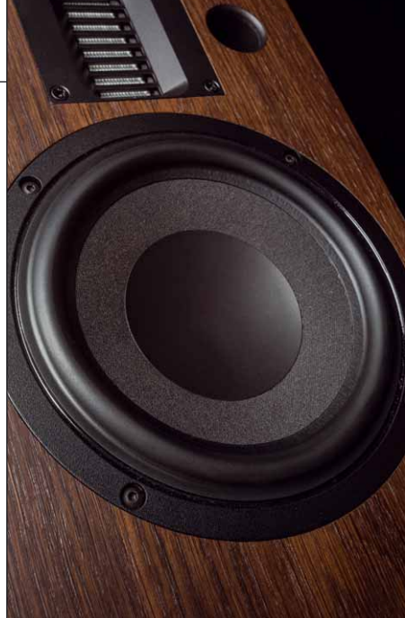
Der Tiefmitteltöner ist ein Glücksgriff, kann er doch mit der Dynamik des einmaligen Hochtöners gut mithalten

Darunter agiert ein 17-Zentimeter-Chassis, dem man seine PA-Gene auch ansehen kann. In Sachen Oberfläche gibt es fünf unterschiedliche Furnierarten, die allesamt sehr schön ausgesucht und verarbeitet sind.