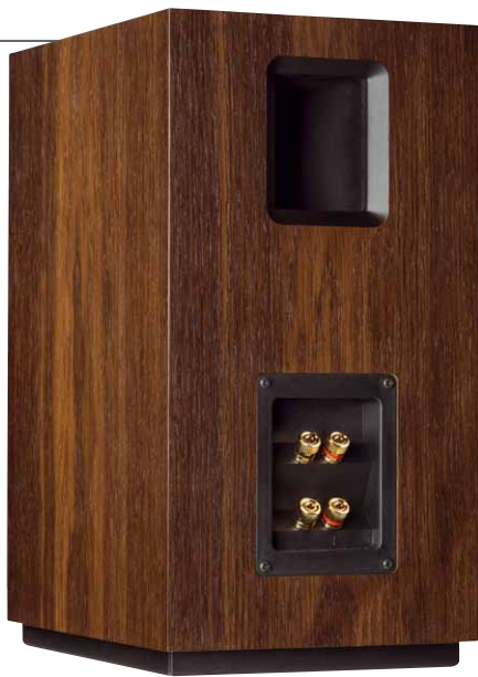
Was aussieht wie ein weiterer Reflexkanal ist die rückseitige Öffnung des „Dipol-Kanals“